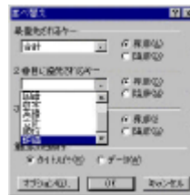
図 4: 「並べ替え」ダイアログボックス

2) 「並べ替え」ダイアログボックスが表示されるので、必要な「キー」とキーの並べ替え (昇順または降順) を選び「OK」ボタンを押す。