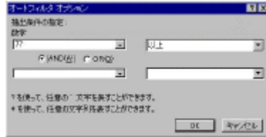
図 6: 「オートフィルタオプション」ダイアログボックス

抽出するときに条件を設定する場合は、ボタンをクリックし「オプション」を選択する。「オートフィルタオプション」ダイアログボックスが開くので、抽出したい項目を設定する。同じリスト内であれば、AND,OR を使って2つまで条件を指定できる。