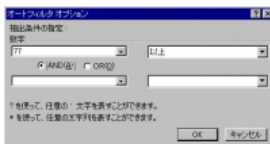
図6：「オートフィルタオプション」ダイアログボックス

抽出するときに条件を設定する場合は、ボタンをクリックし「オプション」を選択する。「オートフィルタオプション」ダイアログボックスが開くので、抽出したい項目を設定する。同じリスト内であれば、AND,OR を使って2つまで条件を指定できる。