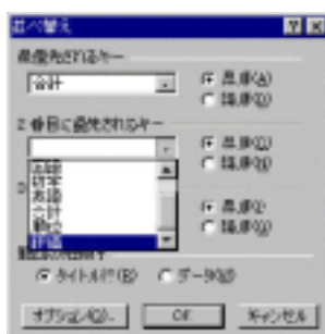
図4: 「並べ替え」ダイアログボックス

2) 「並べ替え」ダイアログボックスが表示されるので、必要な「キー」とキーの並べ替え(昇順または降順)を選び「OK」ボタンを押す。